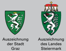
Auszeichnung der Stadt Graz